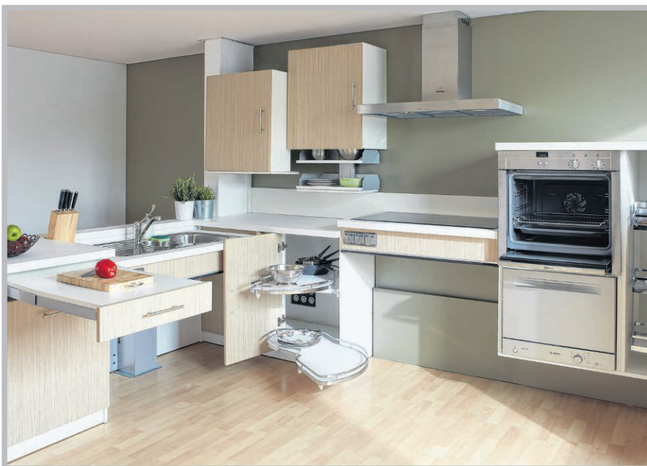
Cuisine Modulhome, le mobilier adapté...

Pas moins de 730 000 bénéficiaires de l'allocation personnalisée d'autonomie (APA) sont accompagnés à la maison, contre 490 000 pris en charge dans des établissements spécialisés. Pour ces personnes âgées, les aidants jouent un rôle fondamental, conjoints, enfants, voisins, amis sont directement ou indirectement impliqués dans l'accompagnement de la personne.