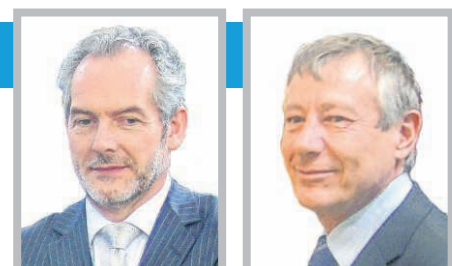
Co-fondateurs du Salon Autonomic.

La Maison de l'Autonomie présente ainsi, sur un espace de 150 m 2 , les nouvelles solutions d'aménagement de l'habitation et des espaces publics. C'est une exposition vivante qui permet de voir et toucher toutes les aides techniques, mais aussi de mieux s'informer sur